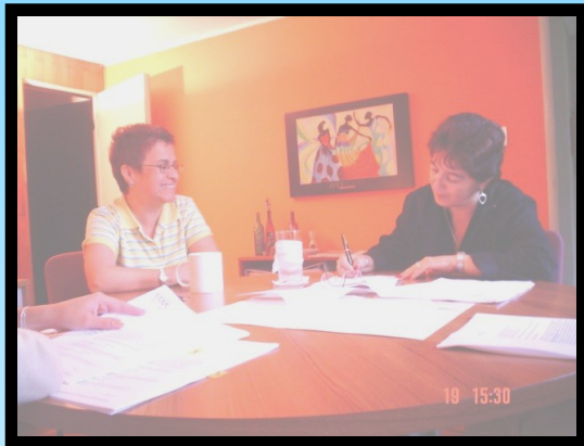
Firma convenio para la documentación de casos