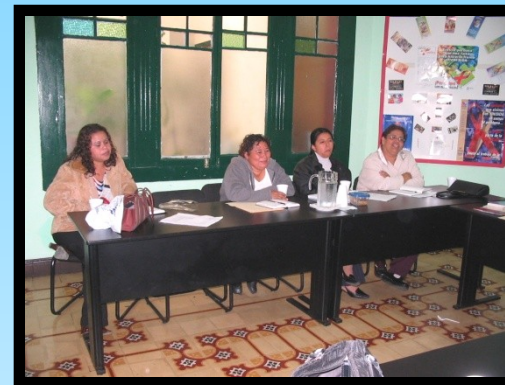
Reunión mensual en AGP.