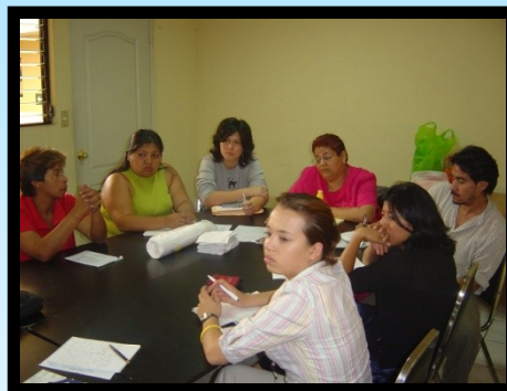
Reunión mensual en la PDH